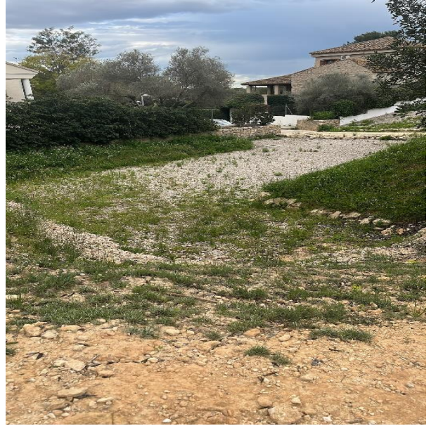
Balsas de contención situada al acabar la calle 345 junto al monte, zona Barranco Rubio